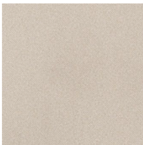
RIVESTIMENTO DEL PADIGLIONE